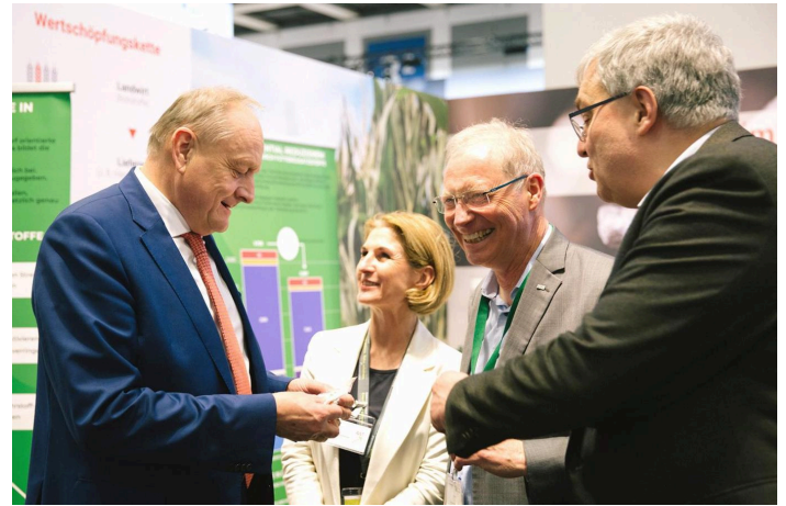
Der Präsident des Deutschen Bauernverbands Joachim Rukwied besuchte den DVT-Stand auf der Grünen Woche 2024. The President of the German Farmers' Association, Joachim Rukwied, visited the DVT stand at Green Week 2024.

Increasing market differentiation, partly due to the demand for GMO-free food, products of regional origin, organic production, and different husbandry systems (in accordance with animal welfare requirements), is making it more complex for the association to represent its members. In 2016, the DVT agreed to work more closely with the German Raiffeisen Association (DRV) in order to further consolidate activities in the feed industry.