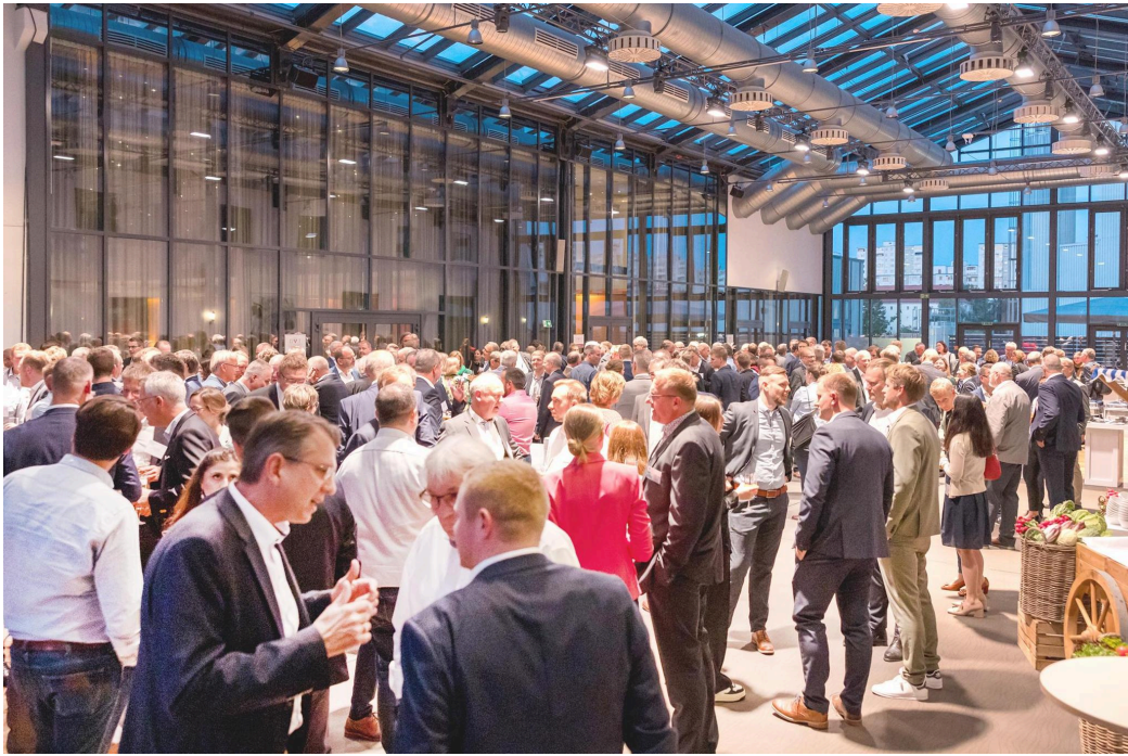
Die Jahrestagung bietet jedes Jahr vielfältige Möglichkeiten des Austauschs, Wiedersehens und Netzwerkers. Every year, the annual conference offers a wide range of opportunities for exchange, reunion and networking.